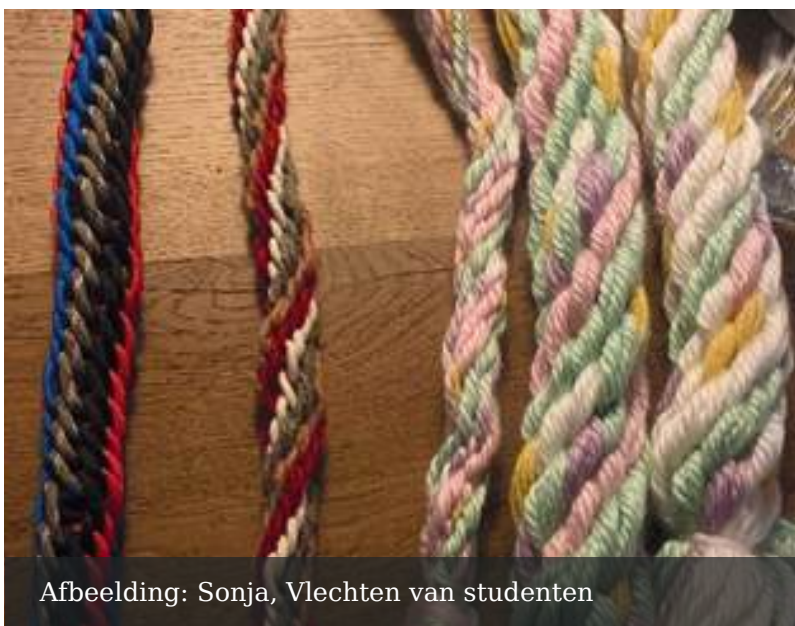
Afbeelding: Sonja, Vlechten van studenten

“We hebben een ontzettend leuke tijd gehad en veel geleerd. Het is echt bijzonder hoe kunst en schilderen zoveel diepgang kunnen hebben. Het gaat inderdaad over veel meer dan alleen over schilderen zelf.”