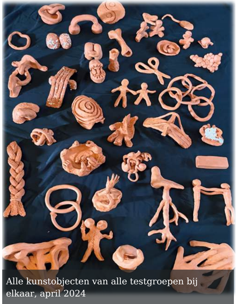
Alle kunstobjecten van alle testgroepen bij elkaar, april 2024

Organiseer, zodra de sculpturen zijn voltooid, een tentoonstelling waarin de studenten hun werk aan elkaar kunnen presenteren. Dit biedt een kans voor reflectie en discussie over de verschillende interpretaties van verbinding die zijn uitgedrukt in de sculpturen.