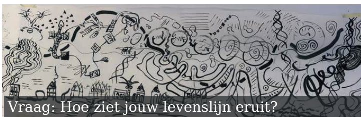
Vraag: Hoe ziet jouw levenslijn eruit?